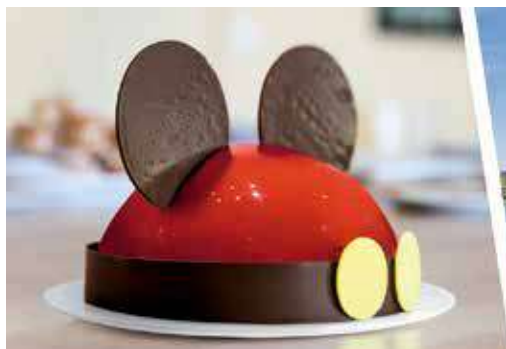
Postre de celebraciones