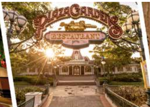
Plaza Gardens Restaurant