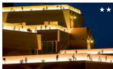
Disney's Hotel Santa Fe desde 95€