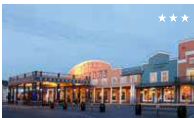
Disney's Hotel Cheyenne desde 101€