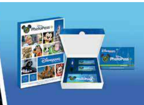
Disney PhotoPass™ +

Condiciones: (1) Precio de 74€ por Photopass. Consulta condiciones. (2) Precio por postre 35€ para un máximo de 8 personas. El postre de cumpleaños es una tarta de chocolate o una tarta de merengue de varias capas que puede sustituirse por otro tipo de postre durante su estancia. (3) Consulta días de operación, horarios, precios y medidas de seguridad en tu agencia de viajes.