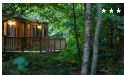
Disney's Davy Crockett Ranch desde 90€