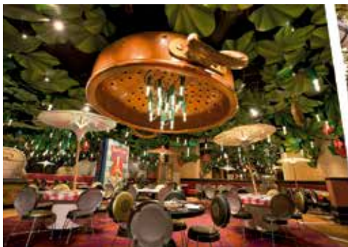
Bistrot Chez Rémy

Te da acceso a todos (4) los Restaurantes Disney.